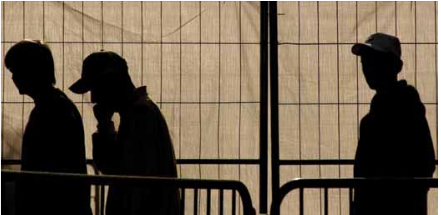
Pressens bild, Camilla Cherry